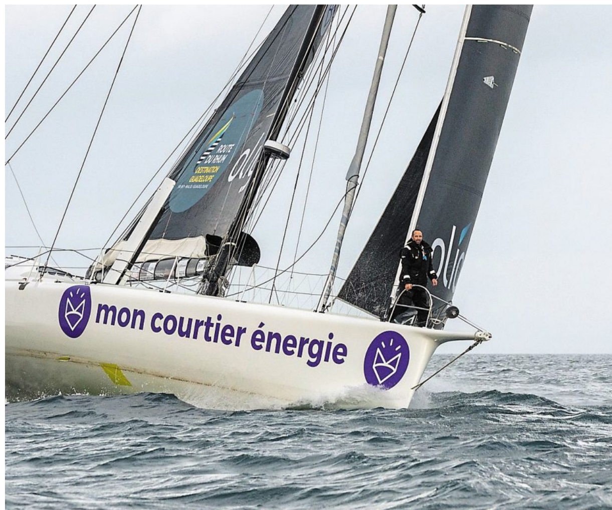
Sur la prestigieuse Route du Rhum, Sébastien Marsset entend capitaliser en vue du Vendée Globe 2024.